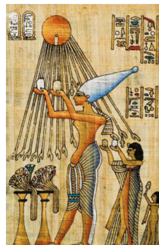
Achnaton a jeho rodina uctívající boha Atona

Tys bylo jediné a první! Vyšlo jsi se svou zárnou tváří a zjevilo ses palčivé a krásné, a když ses blížilo a vzdalovalo, za sebe vytvořilo miliony podob, vesnice, města, pole, cesty, řeky. Veškeré oči před sebou tě vidí, jak nad zemí jdeš, zárné slunce denní!