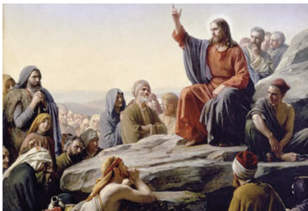
Carl Bloch: Kázání na hoře (1877)

Slyšeli jste, že bylo řečeno: „Milovati budeš bližního svého a nenávidět nepřátele své. Já vám však pravím: „Milujte své nepřátele a modlete se za ty, kdož vás nenávidí. Jednejte s druhými vždy tak, jak chcete, aby oni jednali s vámi.“