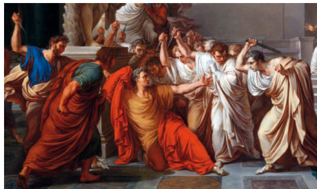
Vincenzo Camuccini: Smrt Caesara (1805)